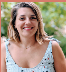
Adeline Thudo Ostéopathie

www.osteofamille.fr Tél : 06 95 20 35 54